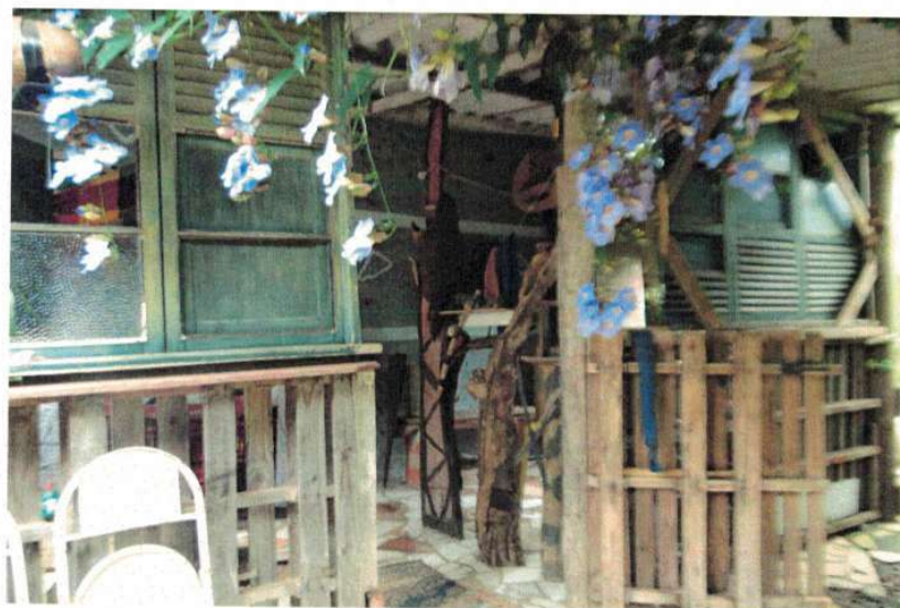
Figura 1 – Fachada da edificação