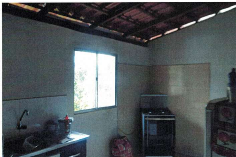
Figura 2 –Interior da edificação

Rua Inhotim nº 600, Bairro Progresso II, Brumadinho/MG Telefone: 31 31 3571-6985 - email: engenharia@brumadinho.mg.gov.br Pág. 5 de 6