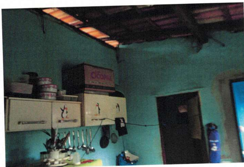
Figura 2 –Interior da edificação

Rua Inhotim nº 600, Bairro Progresso II, Brumadinho/MG Telefone: 31 31 3571-6985 - email: engenharia@brumadinho.mg.gov.br Pág. 5 de 6