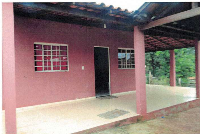
Figura 1 – Fachada da edificação