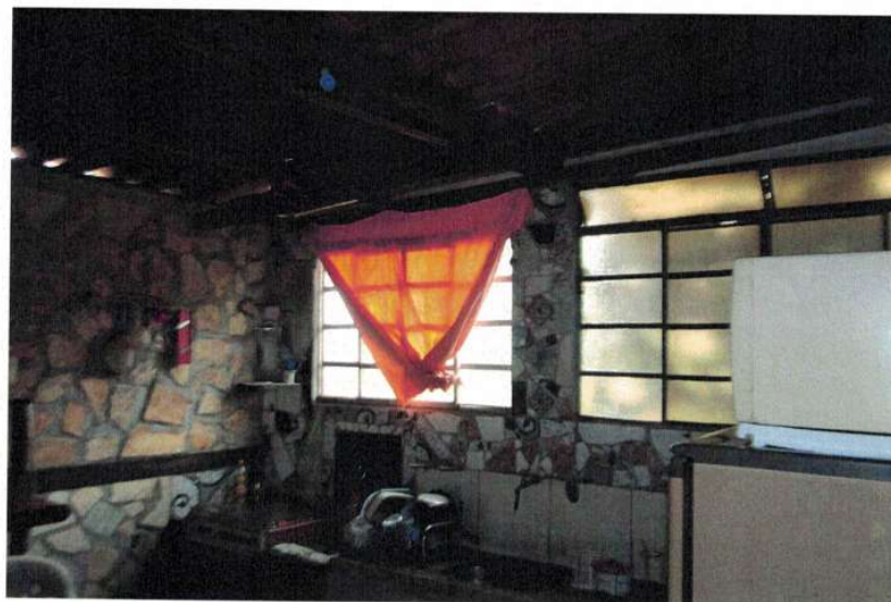
Figura 3 – Interior da edificação

Ubiraci de Alcântara Marques Solha Engenheiro Civil – CREA/ MG 73.344/D Superintendente de projeto