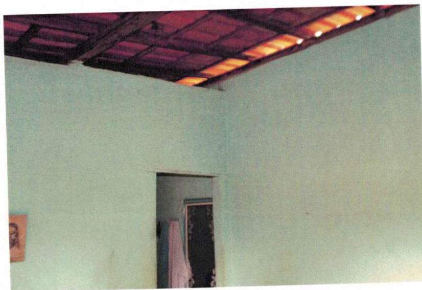
Figura 3 – Interior da edificação

Ubiraci de Alcântara Marques Solha Engenheiro Civil – CREA/ MG 73.344/D Superintendente de projeto