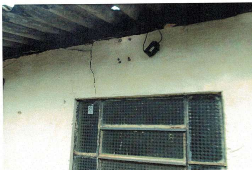
Figura 2 – Trinca aparente na edificação

Rua Inhotim nº 600, Bairro Progresso II, Brumadinho/MG Telefone: 31 31 3571-6985 - email: engenharia@brumadinho.mg.gov.br Pág. 5 de 6