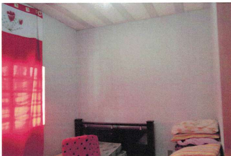
Figura 3 – Interior da edificação

Ubiraci de Alcântara Marques Solha Engenheiro Civil – CREA/ MG 73.344/D Superintendente de projeto