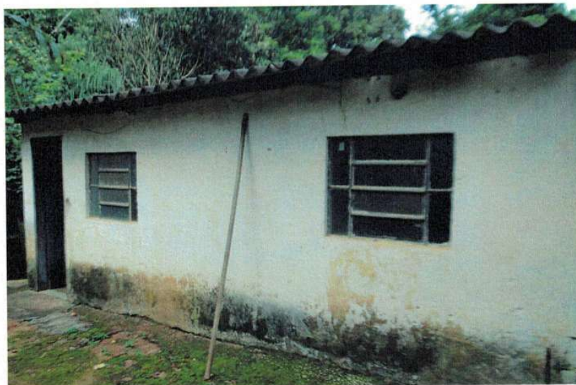
Figura 1 – Fachada da edificação