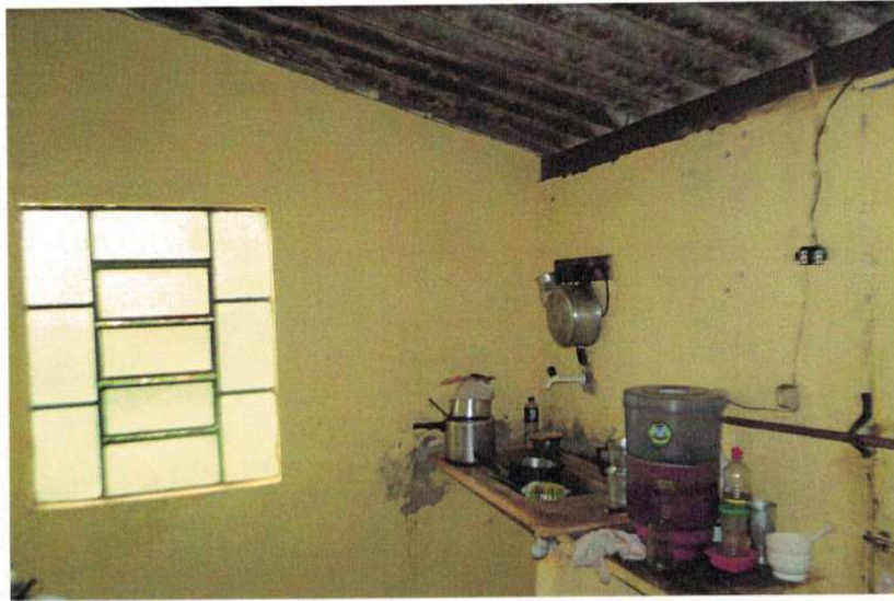
Figura 3 – Interior da edificação

Ubiraci de Alcântara Marques Solha Engenheiro Civil – CREA/ MG 73.344/D Superintendente de projeto